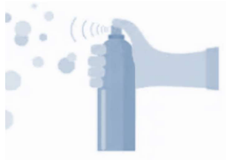
Muestra gráfica de referencia