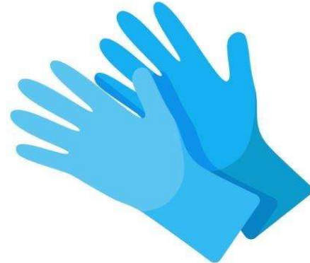
Muestra gráfica de referencia