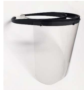
Muestra gráfica de referencia