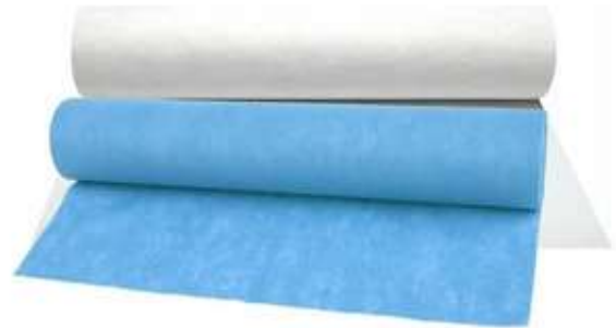
Muestra gráfica de referencia