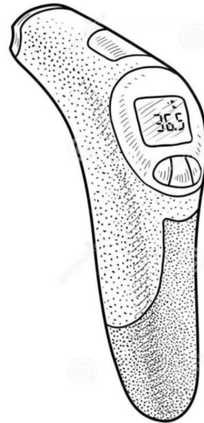
Muestra gráfica de referencia