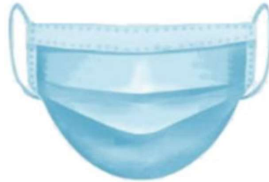
Muestra gráfica de referencia