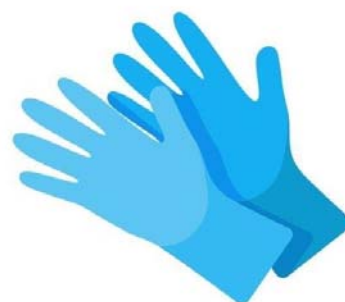
Muestra gráfica de referencia