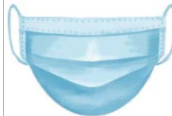
Muestra gráfica de referencia