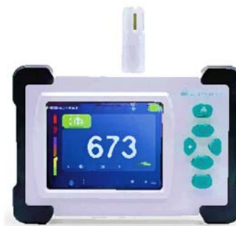
Muestra gráfica de referencia

*Nota: Los datos son de referencia y podrían variar, siempre y cuando estén cercanos al rango o descripción especificado.