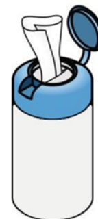
Muestra gráfica de referencia