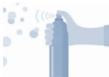
Muestra gráfica de referencia