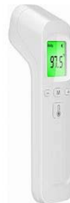
Muestra gráfica de referencia