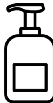
Muestra gráfica de referencia