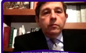
Magistrado en retiro Manuel José Espinosa Corte Constitucional de Colombia