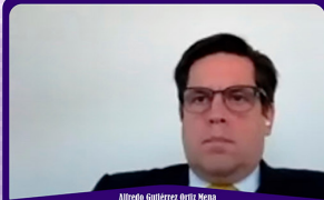
Silvio Gallardo Buitrago Ministro de la Suprema Corte de Justicia de la Nación