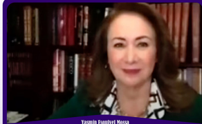
Isabella Espinosa Mesa Ministra de la Suprema Corte de Justicia de la Nación