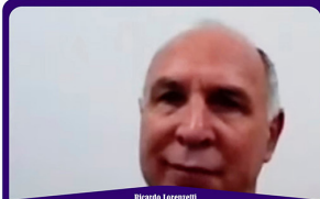
Ricardo Lorenzelli Ministro de la Corte Suprema de Justicia de la Nación Argentina