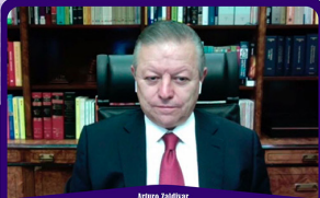
Arturo Zaldívar Presidente de la Suprema Corte de Justicia de la Nación