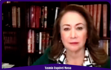
Yasmín Esquivel Mossa Ministra de la Suprema Corte de Justicia de la Nación