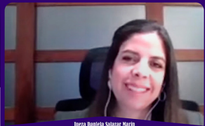
Juiza Beatriz Salazar Murillo Corte Constitucional del Ecuador

Dirección General de Relaciones Institucionales