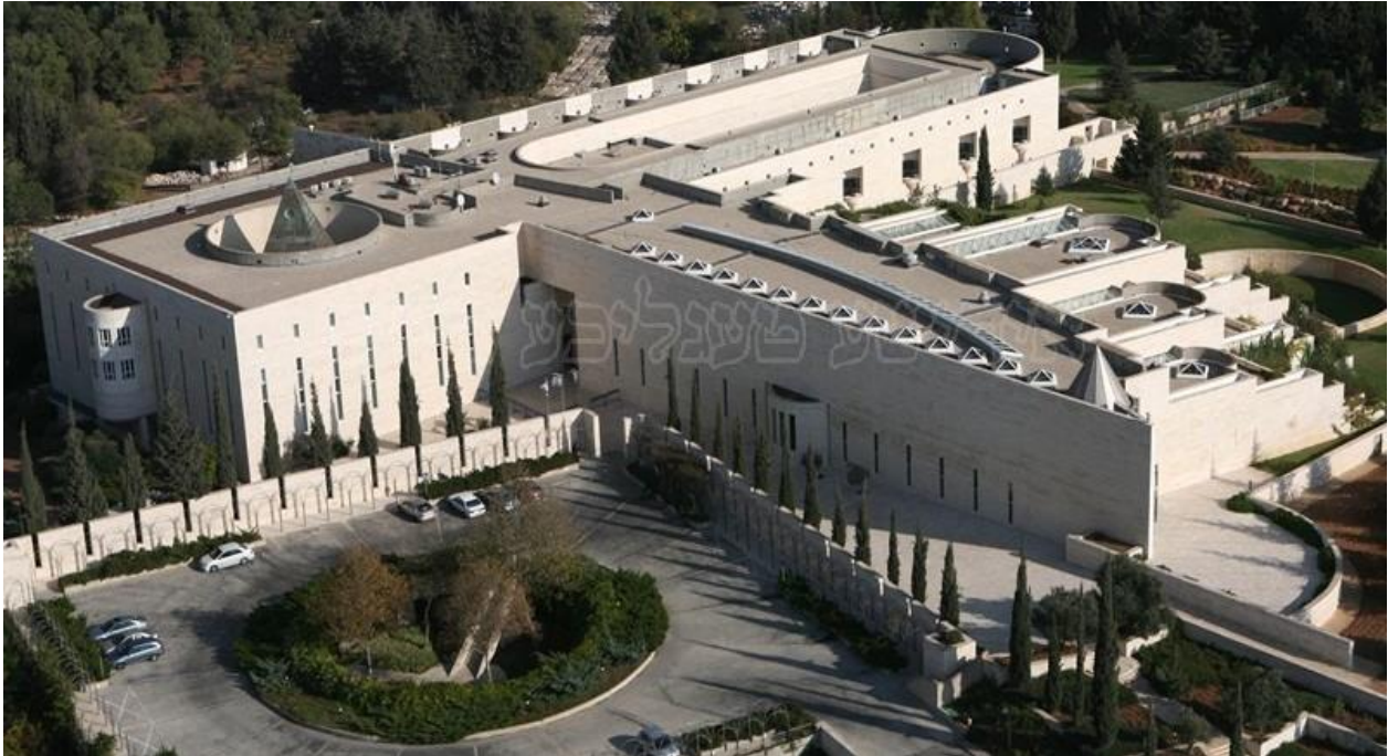
Israel, Corte Suprema