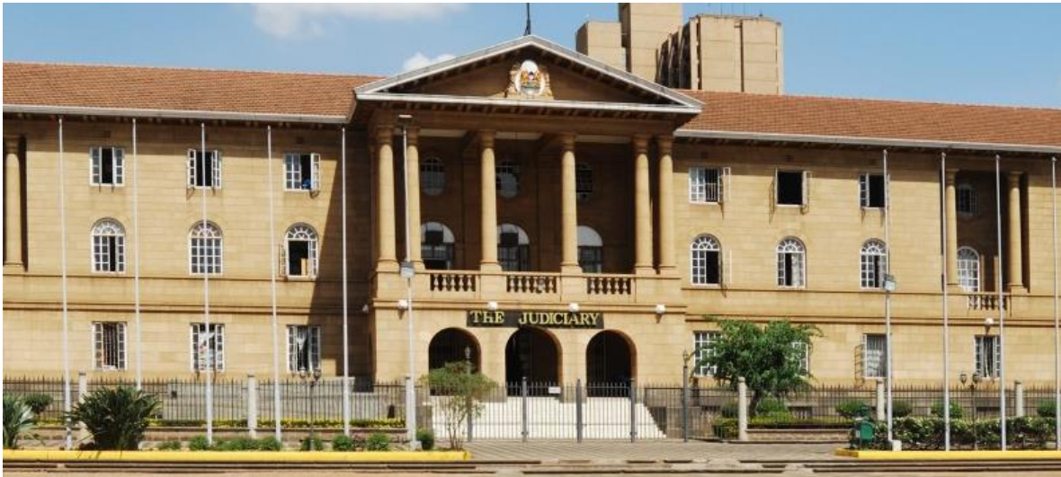
Kenia, Corte Suprema