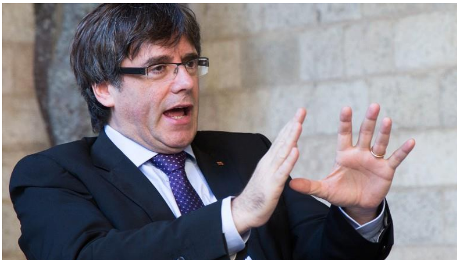
Rechazaron sus alegaciones contra la decisión de suspender el pleno de investidura