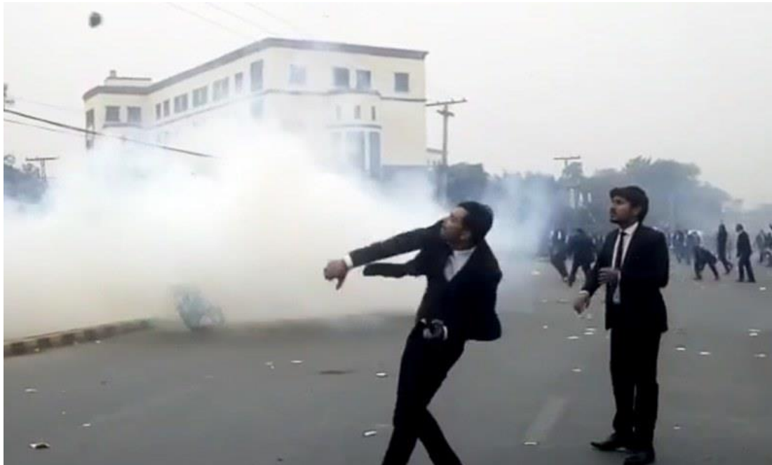
Tres pacientes del hospital fallecieron tras el ataque de los abogados