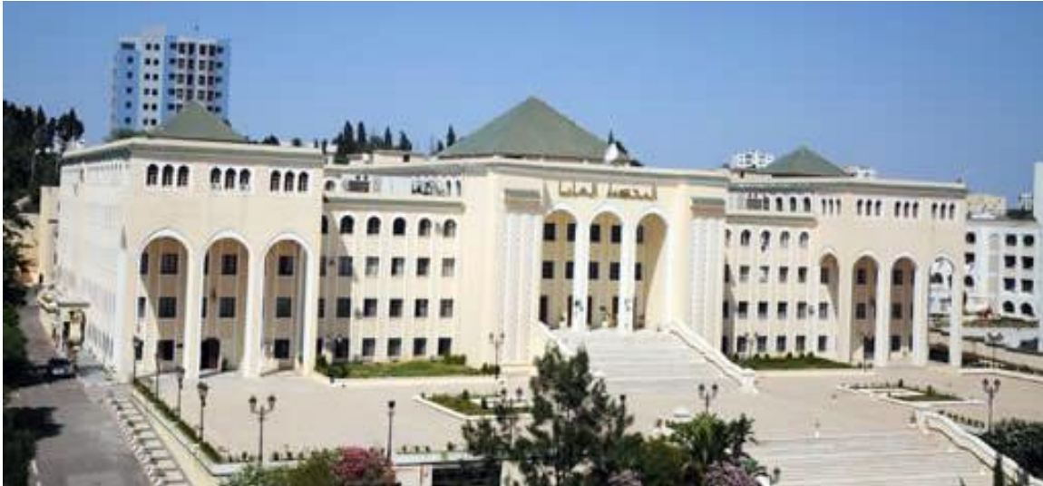
Argelia, Corte Suprema