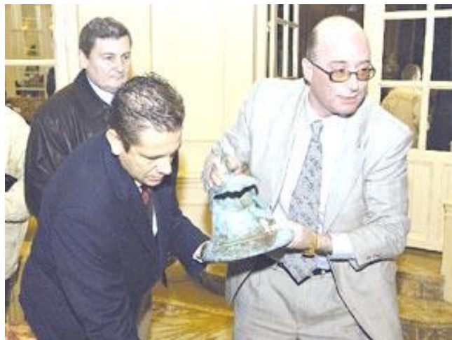
La campana de Colón en plena disputa