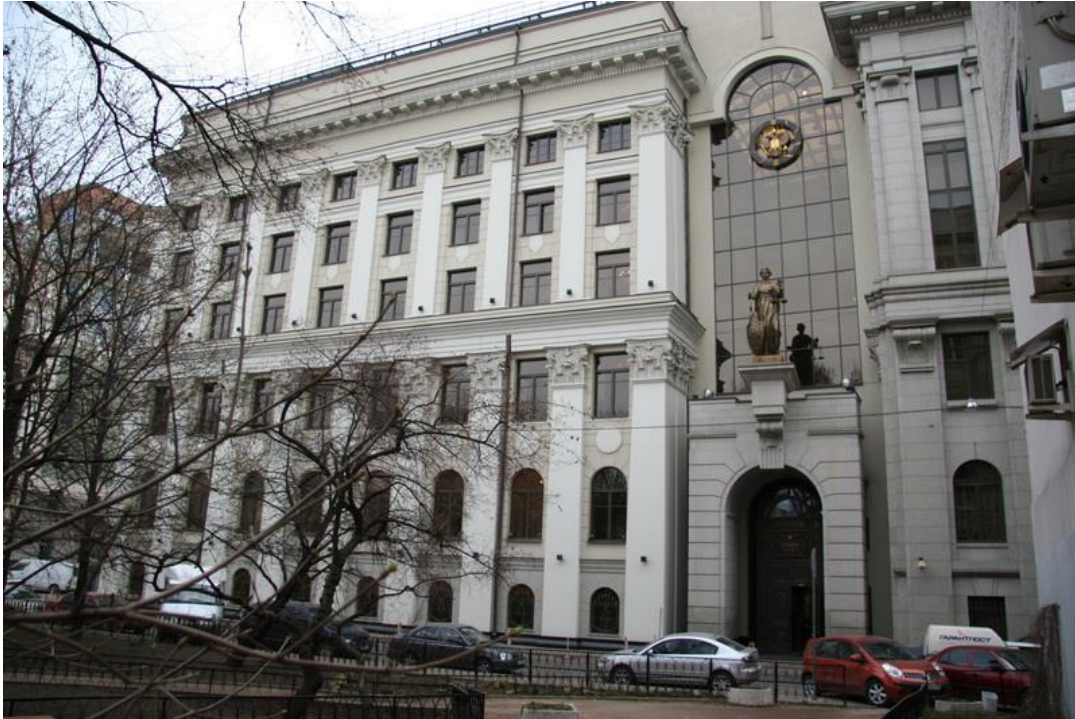
Rusia, Corte Suprema