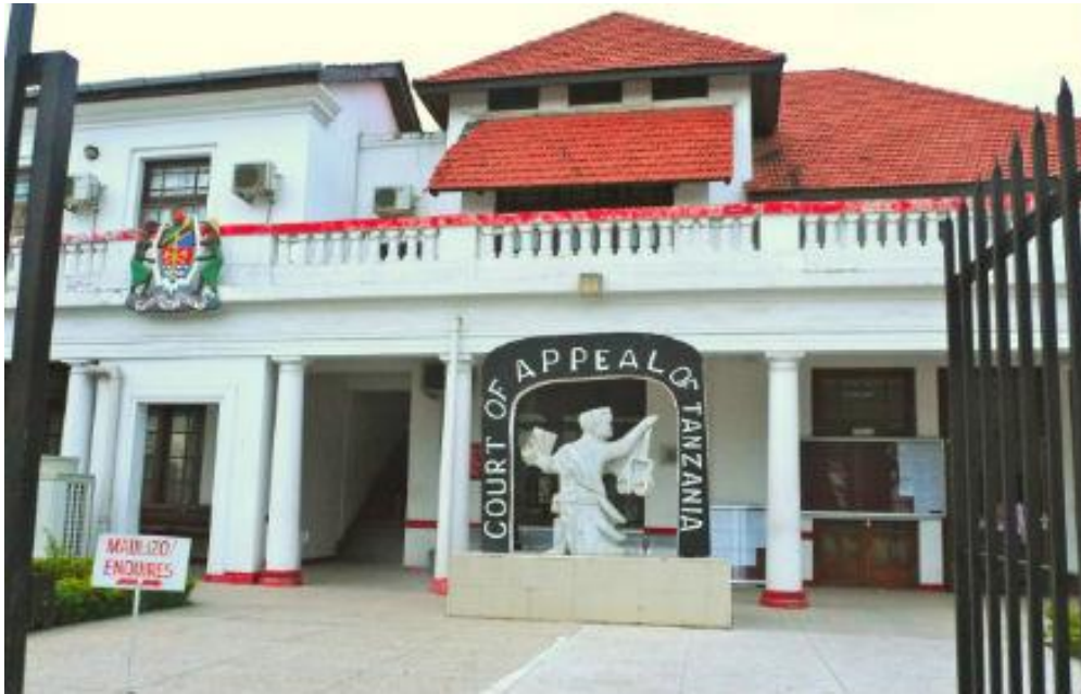
Tanzania, Corte de Apelaciones