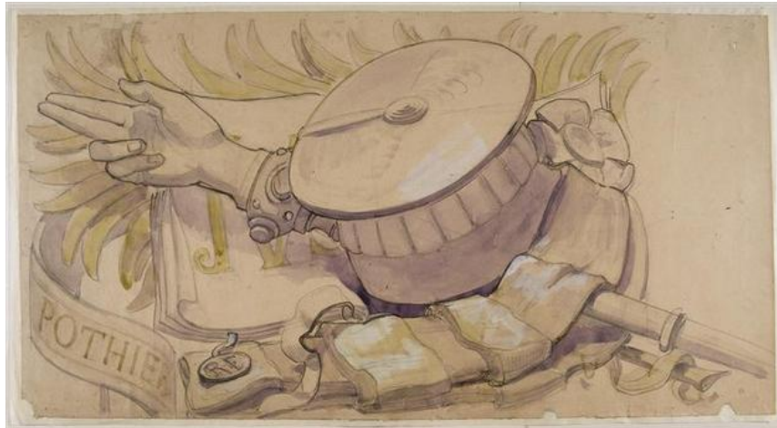
Obra de Charles Lameire (1832-1910)