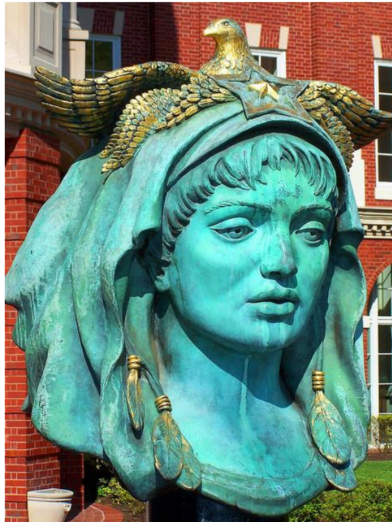
Escultura de Audrey Flack en los Juzgados de Knoxville, EEUU.