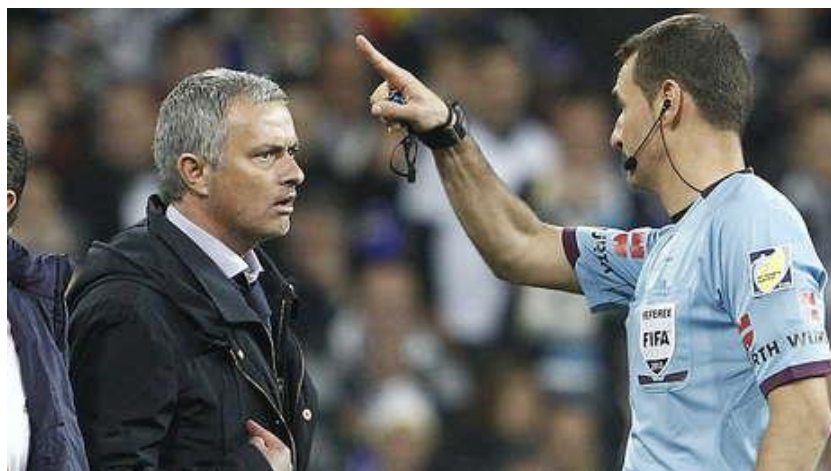
De alto riesgo