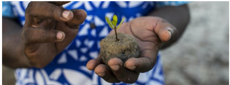
Día Internacional de los Bosques