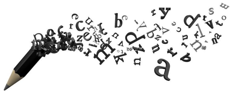
Día Mundial de la Poesía