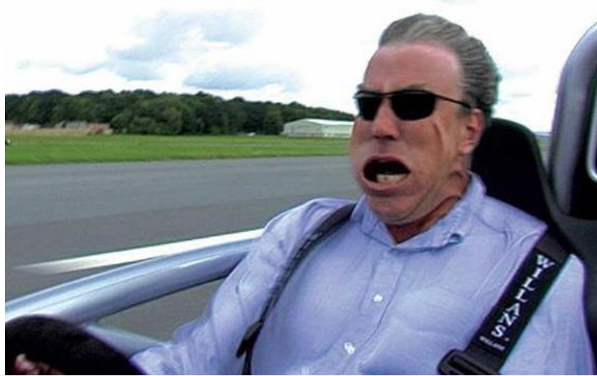
Delito de conducción con grave desprecio a la vida de los demás