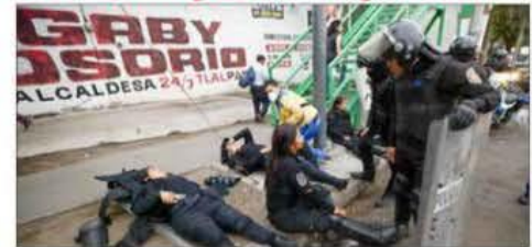
▲ Un grupo de taxistas bloqueó tres puntos de la alcaldía Tlalpan. Siete agentes resultaron lesionados, tres de ellos al ser embestidos por un taxi, cuyo chofer fue detenido. Foto Víctor Camacho / P 24