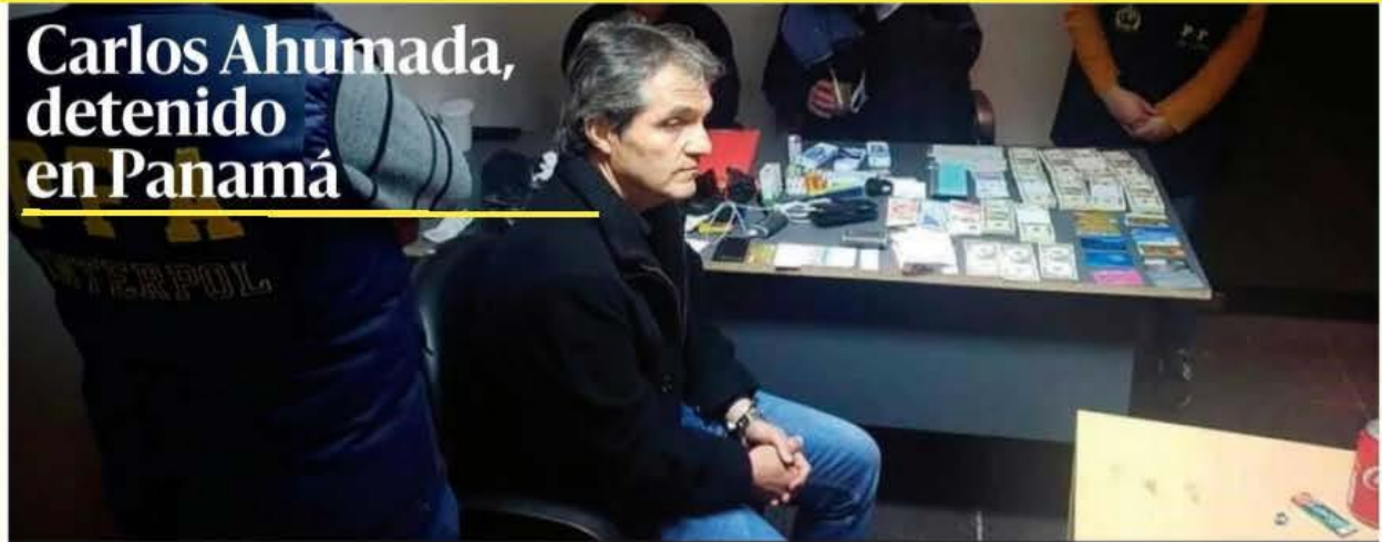
Carlos Ahumada fue detenido ayer por autoridades migratorias de Panamá, en respuesta a una Alerta Azul de la Interpol girada contra el empresario argentino nacionalizado mexicano; la FGR lo acusa por los delitos de enriquecimiento ilícito y defraudación fiscal por un millón 647 mil 236 pesos. PAG 6