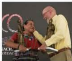
El arqueólogo Eduardo Matos Moctezuma, Premio Crónica, recibió un homenaje en la FIL de Coyoacán por su trayectoria