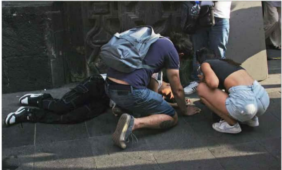
▲ Al menos ocho jóvenes resultaron intoxicados por beber alcohol en una fiesta convocada a través de redes sociales que reunió a miles de chicos de 15 a 17 años en un establecimiento ubicado en Madero 20, Centro Histórico de la CDMX. Los encargados del local permitieron