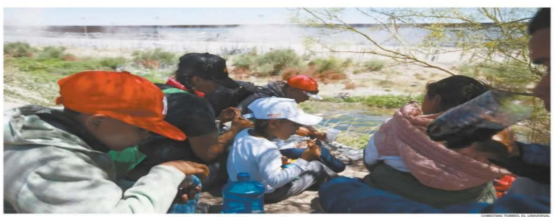
IMAGEN DEL DÍA CALOR LOS ALEJA DE LA FRONTERA Ciudad Juárez, Chih. — Las altas temperaturas que se registran en esta ciudad, que superan los 40 grados, y los operativos que realiza la Guardia Nacional en el bordo del río Bravo han ahuyentado la presencia de migrantes que llegan a esa zona en busca de cruzar a Estados Unidos. Los pocos que se quedan intentan resguardarse en los matorrales, a un costado del río; la mayoría espera en algún albergue. | ESTADOS | A11