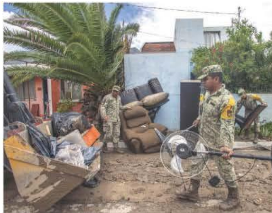
ELEMENTOS de la Sedena activaron el Plan DN-III-E en Nuevo León, ayer.

EN NUEVO LEÓN , desgajamientos y la presa La Boca al 105% de llenado; en el sistema Cutzamala, lo opuesto: optan por bajar caudal. págs. 4 y 5