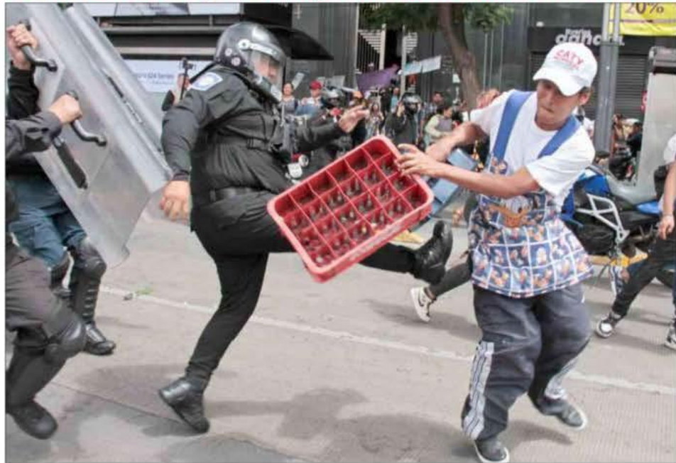
▲ Seis trabajadores del gobierno capitalino y dos policías auxiliares resultaron lesionados en el zafarrancho entre ambulantes y elementos de la Secretaría de Seguridad Ciudadana local, cuando los uniformados intentaron replegar a los vendedores, que por segundo día consecutivo bloquearon Eje Central y avenida Juárez en demanda de espacios para expender su mercancía. Foto Germán Canseco E. BRAVO / P 25