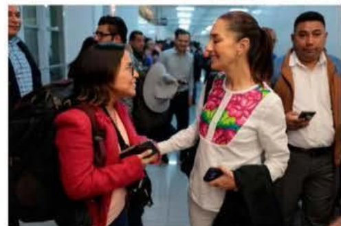
La segunda gira de fin de semana de la presidenta electa será en Oaxaca, lo que dio oportunidad a que Sheinbaum conviviera en el aeropuerto con los pasajeros con los que compartiría vuelo