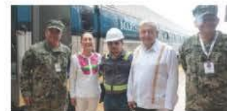
LA VIRTUAL Presidenta electa y el Presidente Andrés Manuel López Obrador, ayer, en Oaxaca.

MUESTRAN efectos las medidas para restringir el tránsito hacia el norte; en mayo, 170 mil detenciones; activistas ven como consecuencia un varamiento de indocumentados en México. pág. 10