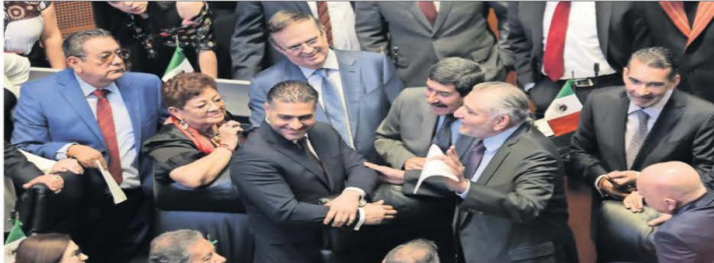
Las nuevas caras morenistas en el Senado de la República: Félix Salgado Macedonio, Ernestina Godoy Ramos, Marcelo Ebrard Casaubon, Omar García Harfuch, Javier Corral Jurado y Adán Augusto López Hernández, en la sesión constitutiva de la nueva legislatura que se efectuó ayer. | NACIÓN | A8