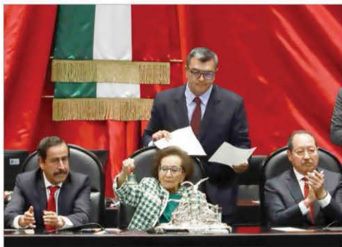
▲ La sesión de ayer en la Cámara baja, en la que se ratificó a Ifigenia Martínez como titular de la Mesa Directiva y como tal entregará la banda presidencial a Claudia Sheinbaum, se convirtió en