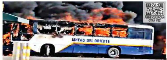
■ Culiacán vivió ayer una jornada violenta con quema de vehículos y narcobloqueos.

"Como consecuencia de lo expuesto, la vinculación entre la situación y ubicación de Ovidio "G", la participación de su hermano Joaquín en el presunto secuestro de Ismael "N", la violencia con la que se llevó a cabo el mismo, así como las evidentes irregularidades del avión y del vuelo del secuestro, son materia fundamental de la investigación de esta institución, por los delitos cometidos en México".