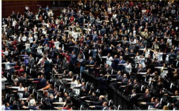
DIPUTADOS electos rinden protesta durante la Sesión Constitutiva, ayer.