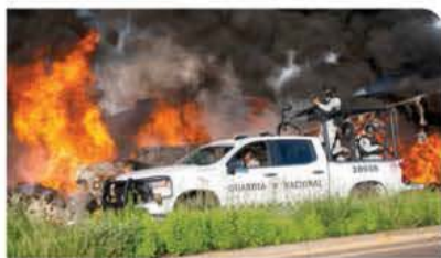
VEHÍCULOS incendiados fueron reportados ayer, en Culiacán.

Fiscalía General presenta cronología; afirma que excarcelación del hijo de El Chapo fue dos días antes del secuestro de El Mayo ; desconoce su estatus y su ubicación págs. 3 y 4