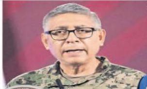
Con un perfil más administrativo que operativo, el almirante Raymundo Morales encabezará la Marina.