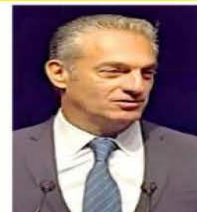
Carlos Slim Domit, ayer en el foro con becarios.

“Con unidad nacional y Estado de derecho, estas dinámicas tienen un potencial enorme para generar un crecimiento fuerte y sostenido”, afirmó.