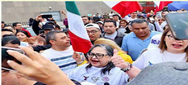
'INO VA A CAER!'. Como sus pares y antagonistas, Lenia Batres y Loretta Ortiz (quienes encabezaron un mitin el jueves pasado), la titular de la Corte, Norma Piña, salió a la calle ayer a arengar a los trabajadores del Poder Judicial que desde el martes bloquean la Cámara de Diputados. Gritó con ellos, con el puño en alto: "¡El Poder Judicial no va a caer!"

“Desde la primera sesión de la Comisión de Puntos Constitucionales nosotros pedimos más tiempo. ¿Qué urgencia hay? Los legisladores apenas están entrando. No han tenido la oportunidad ni siquiera de conocer el dictamen. Hay que tener un