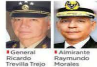
En marzo de 2021, fue nombrado por Sandoval como Jefe del Estado Mayor de la Defensa y luego ascendido a General de División.

La Presidenta Claudia Sheinbaum hizo una apuesta por la experiencia y la continuidad en la Secretaría de la Defensa Nacional (Sedena), al designar al General Ricardo Trevilla como nuevo titular de la dependencia, y a Raymundo Pedro Morales Angeles al frente de la Secretaría de Marina.