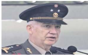
El general Ricardo Trevilla, próximo secretario de la Defensa, es cercano al actual titular del Ejército.