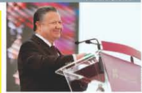
EL GOBERNADOR, ayer, durante su informe.

En 2019 fue liberado y se convirtió en testigo clave del caso bajo el alias de Juan ; en 2020 señaló a mandos del Ejército con la desaparición de normalistas, pero nunca aportó pruebas