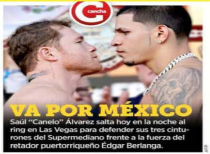
VA POR MÉXICO Saul “Canelo” Álvarez salta hoy en la noche al ring en Las Vegas para defender sus tres cinturones del Supermediano frente a la fuerza del retador puertorriqueño Edgar Berlanga.

Las fuentes consideraron que el Pleno de la Corte tendría que aclarar el tema lo antes posible, probablemente mediante un Acuerdo General, que establezca que la desaparición de las Salas sólo surtirá efectos hasta que se concrete la nueva integración con nuevos Ministros, el número más reducido en la historia de la Corte.