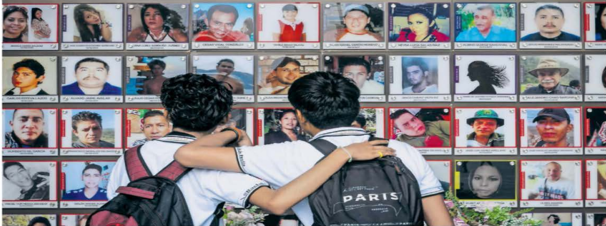
En el Palacio de Gobierno de Cuernavaca, Morelos, se encuentra un memorial de víctimas que fue instalado por colectivos de buscadoras.