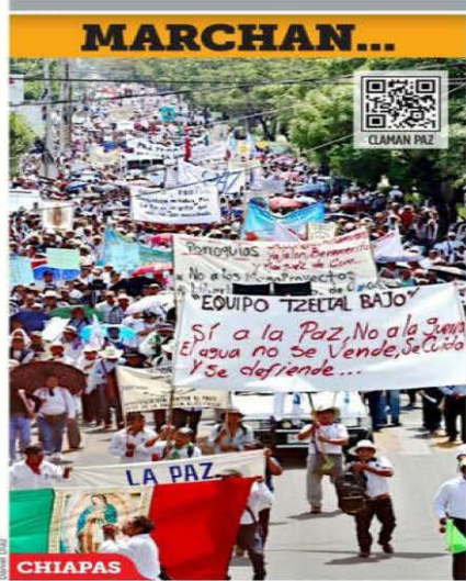
CHIAPAS Mientras en Tuxtla Gutiérrez marcharon para exigir un alto a la violencia, en la Tierra Caliente michoacana pararon labores los limoneros y en la autopista Durango-Mazatlán se registró la quema de vehículos.