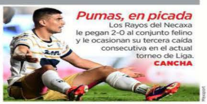
Pumas, en picada Los Rayos del Necaxa le pegan 2-0 al conjunto felino y le ocasionan su tercera caída consecutiva en el actual torneo de Liga. CANCHA