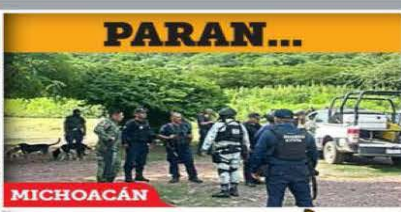
MICHOACÁN SÁBADO 14 / SEP. / 2024 CIUDAD DE MÉXICO