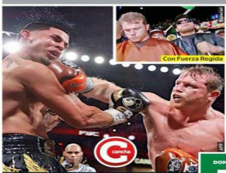
Con Fuerza Regida