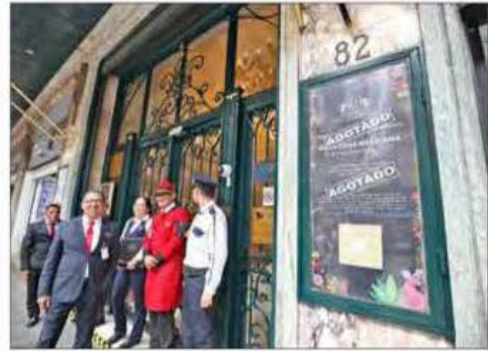
hasta 4 mil pesos para incluir además dulces típicos, tequila o mezcal. En tanto, las reservaciones en hoteles y restaurantes ubicados en el Centro Histórico están agotadas. ÁNGEL BOLAÑOS Y ELBA MÓNICA BRAVO / P 26