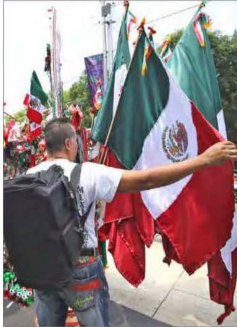
▲ Los capitalinos alistan su noche mexicana. Se volcaron a las calles para comprar banderas y adornos tricolores. Entre las familias, el pozole se mantiene como el platillo favorito, para lo cual abarrotaron mercados (en la imagen, el de Portales) e invirtieron desde mil 500