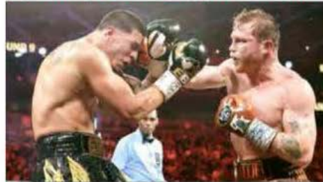
▲ Saúl Álvarez (derecha) conservó sus tres cinturones de peso supermediano al vencer por decisión unánime al boricua Édgar Berlanga en Las Vegas. Foto Alp REDACCIÓN / P 30