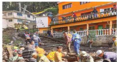
Personal de la Marina, Sedena, Guardia Nacional y Protección Civil trabajaban ayer en el rescate de personas atrapadas bajo el lodo.