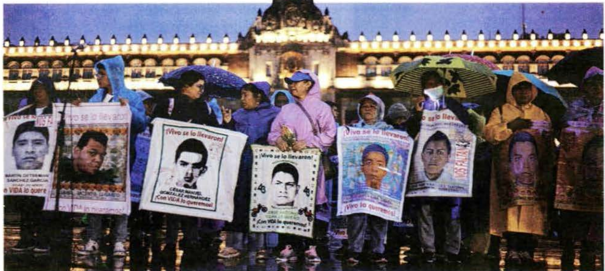
El gobierno capitalino calculó en 10 mil la cifra de los participantes en la marcha por el décimo aniversario de la noche de Iguala.