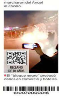
El "bloque negro" provocó caos en comercio y hoteles.

Mejoran, pero no convencen 20-15 TV DALLAS NY GIANTS CANCHA Los autos chocolates legalizados por el actual Gobierno superan las ventas totales de autos nuevos en el País entre 2022 y 2023, que fueron de 2 millones 547 mil unidades. La Asociación Mexicana de Distribuidores de Automotores (AMDA) ha promovido varios amparos para impugnar el programa, y en junio de 2023, cuando López Obrador extendió su vigencia original, advirtió que el Gobierno estaba "alentando la cadena delictiva del contrabando automotriz".