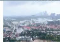
ZONA Diamante bajo el agua.