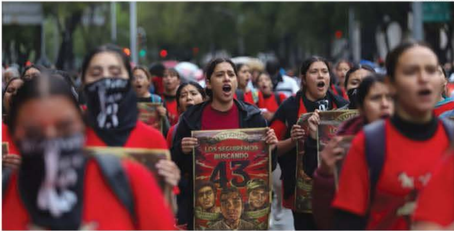
Se cumplió una década de la desaparición de los normalistas de Ayotzinapa y el reclamo persiste: "Faltan 43". PAG 7

PRESIDENTE DEL CONSEJO DE ADMINISTRACIÓN: JORGE KAHWAGI GASTINE // DIRECTOR GENERAL: RAFAEL GARCÍA GARZA // AÑO 28 N° 10.103 $10.00 // VIERNES 27 SEPTIEMBRE 2024 // WWW.CRONICA.COM.MX