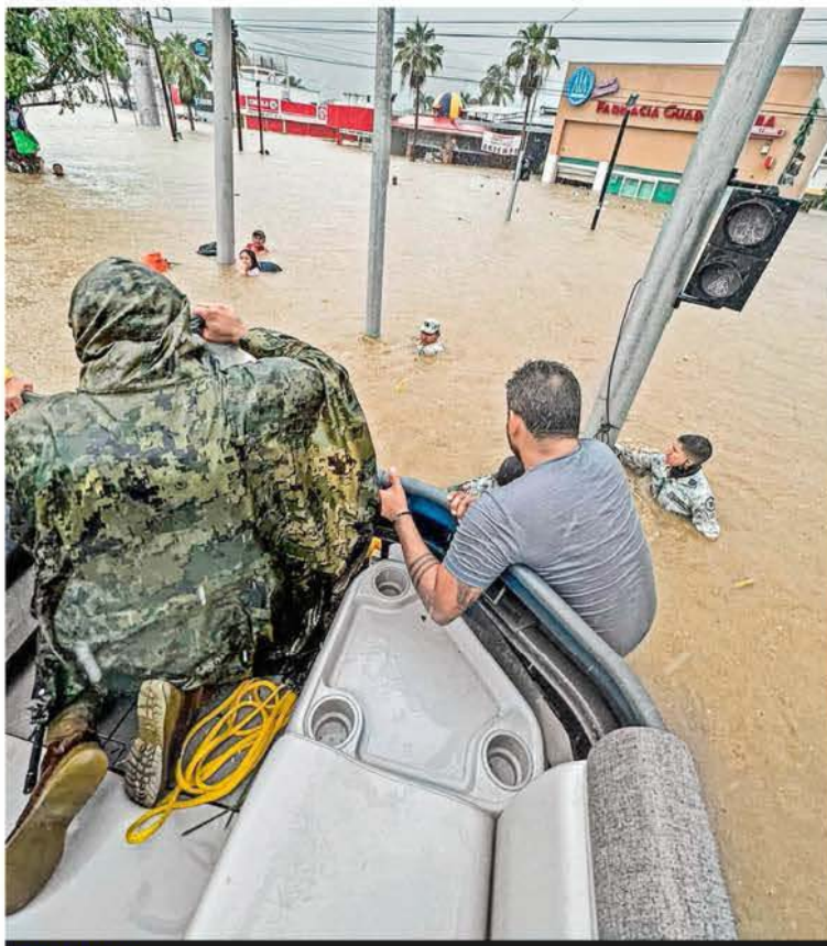
DEVASTADOR. En el Bulevar de las Naciones, una de las vías más importantes de Acapulco Diamante por su cercanía con el Aeropuerto, las inundaciones a causa de John superaron el metro y medio de altura ESTADOS P. 11

BANXICO BAJA LA TASA 25 PUNTOS Y LA DEJA EN 10.50% NEGOCIOS P. 14