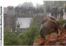
GN atiende deslizamientos de tierra.

LLUVIA DE 5 DÍAS ES CASI EL TRIPLE DE LA QUE DEJÓ OTIS