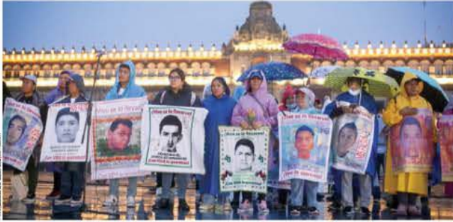
MITIN de padres de los 43 normalistas de Ayotzinapa, ayer frente a Palacio Nacional.