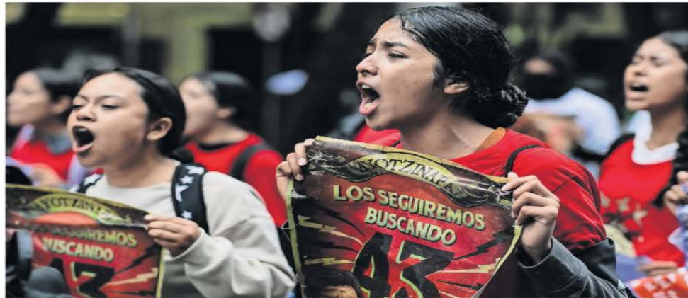
Estudiantes marcharon hacia el Zócalo con consignas de exigencia de justicia y con la convicción de que no permitirán que el caso quede impune.

En la marcha realizada en la Ciudad de México reprochan al gobierno federal la simulación política para resolver el caso; dichos de Encinas son "justificaciones indefendibles", critican