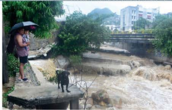
FUERZA de la lluvia generada por John arrasa con casas y deja aislados a habitantes en Acapulco.

CIFRA iguala al pico máximo registrado el 15 de septiembre; en entidad gobernada por Rocha Moya ya suman 92, según datos oficiales, y 98 extraoficiales. pág. 17