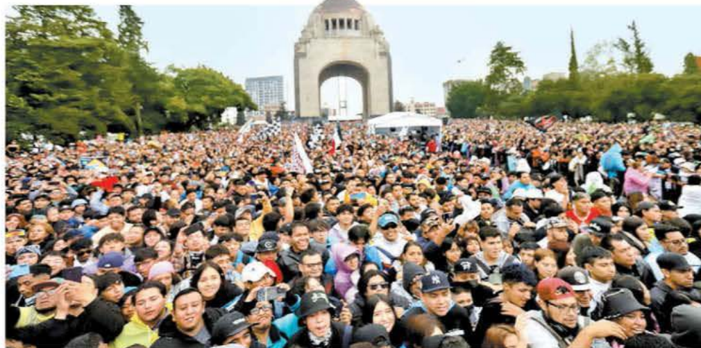
Miles de personas despidieron al Presidente en el AMLO Fest del Monumento a la Revolución. ARIELOJEDA