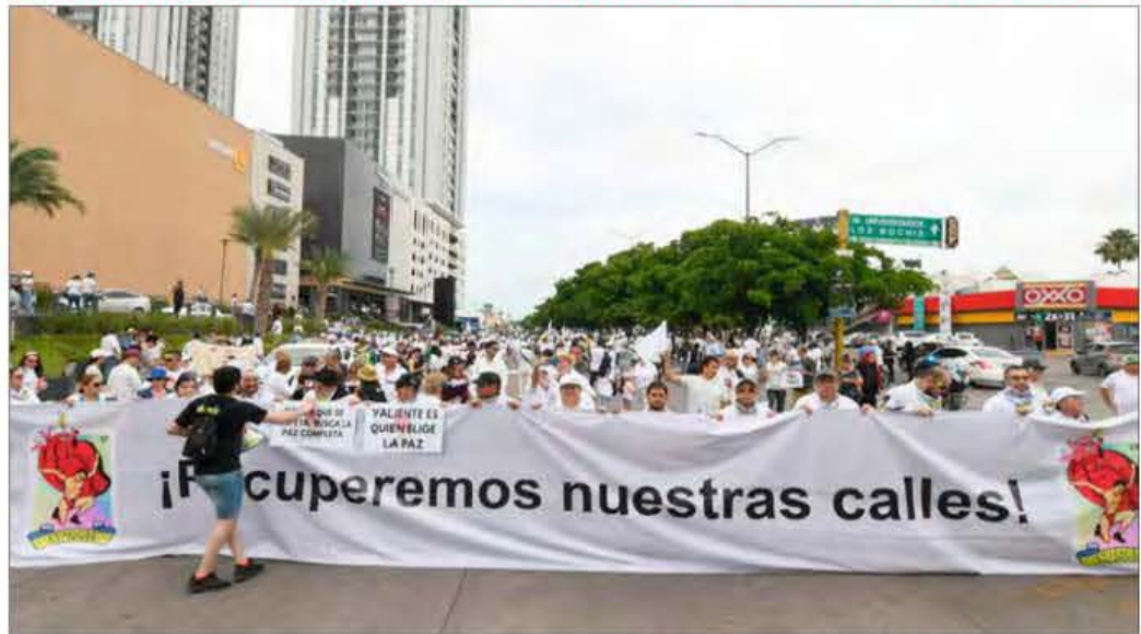
▲ En el 483 aniversario de la fundación de Culiacán, cientos de personas marcharon en demanda de paz y un alto a la violencia que ha dejado unas cien personas muertas desde el 9 de septiembre pasado, como consecuencia de la pugna entre Los Chapitos y Los Mayitos . Los ciudadanos, entre ellos buscadores de desaparecidos, empresarios, transportistas y estudiantes, llegaron vestidos de blanco y portando una lona con la leyenda "Recuperemos nuestras calles". Foto El Debate IRENE SÁNCHEZ, CORRESPONSAL / P 35