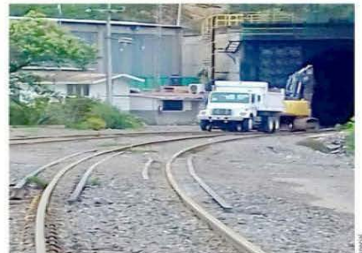
Los pobladores de Puente Colorado, en Chapulco, Puebla, bloquean la vía con vehículos.

"Su abasto natural es por Veracruz y tienen efectua-