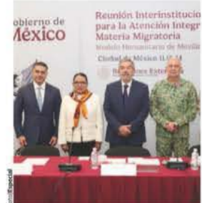
TITULARES de Seguridad, Gobernación, Relaciones Exteriores y Defensa, ayer.

Tránsito por la entidad debe ser rápido, pues el "permiso" vence y tienen que volver a pagar; por eso, caravana se desplaza rápido, afirma activista; "mover migrantes", negocio redondo