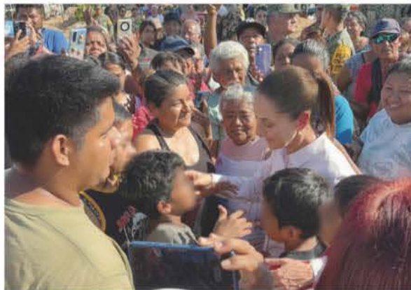
LA PRESIDENTA Claudia Sheinbaum, ayer, con damnificados por John en Acapulco.

KENSALAZAR ya no se comunicará directo con secretarios de Estado; "se ordena" relación bilateral. CSP, pág. 4