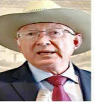
Las labores de Ken Salazar serán acotadas.

"Fueron algunos de los lineamientos que se establecieron ayer (jueves) y eso ordena de manera muy importante la relación", indicó. En la pasada Administración, además de llamar directamente a distintos funcio-