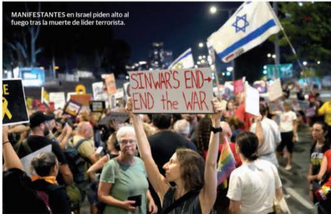
MANIFESTANTES en Israel piden alto al fuego tras la muerte de líder terrorista.

INSTA Netanyahu a terroristas a deponer armas y liberar a rehenes para terminar conflicto; Occidente celebra "es un buen día para Israel y el mundo".