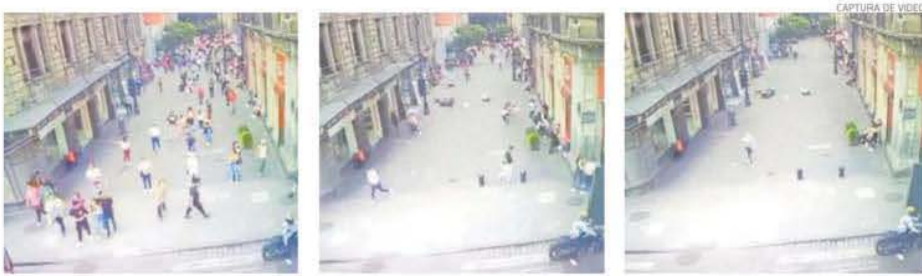
CAPTURA DE VIDEO