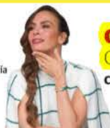
LA ARTISTA, en una fotografía de archivo.