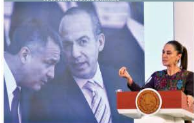
LA PRESIDENTA Claudia Sheinbaum, durante su conferencia mañanera, ayer.

WWW.RAZON.COM.MX VIERNES 18 DE OCTUBRE DE 2024 | NUEVA ÉPOCA | AÑO 16 | NÚMERO 4779 PRECIO $10.00