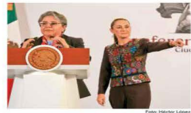
La presidenta Sheinbaum y la titular de la SFP explicaron que se buscará evitar que funcionarios incurran en actos de colusión.