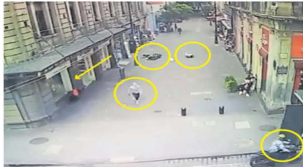
El sicario disparó contra Sánchez, quien iba con dos acompañantes. Uno quedó sobre el piso. La lidereza corrió a una farmacia donde fue alcanzada por el agresor, tras herirla huyó con su cómplice en una moto.

Precariedad permea en Escuela Superior de Música Alumnos acuden a clases en salones sin mantenimiento y con instrumentos viejos. A25