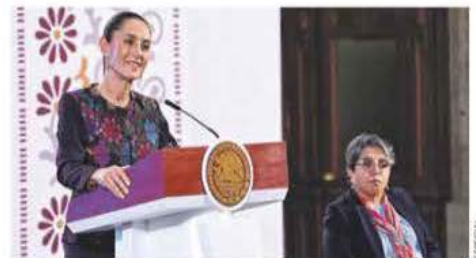
Secretaría Anticorrupción. Asumirá el rol del Inai sin ser juez y parte.

KEN SALAZAR PRESUME BUENA RELACIÓN CON SHEINBAUM; 'NO HAY PAUSA CON MÉXICO'. PÁG. 42