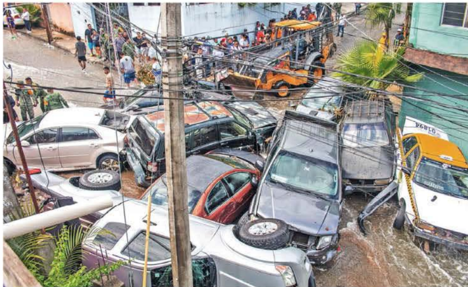
TERRIBLES LLUVIAS. En Nuevo León, las tormentas de la noche del miércoles dejaron cuatro muertos y provocaron el deslizamiento de varios vehículos, lo que complicó el tránsito en varios municipios de la zona metropolitana de Monterrey ESTADOS P. 10

MATAN A YAHYA SINWAR, LÍDER DE HAMÁS; GUERRA CONTINÚA MUNDO P. 16