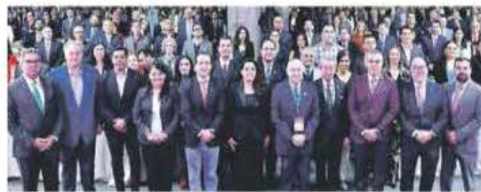
Líderes. Discutieron el futuro del comercio exterior y la inversión en el país.

En estos momentos se necesita ser estratégicos e incentivar a las