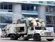
La mayoría de camiones no está en buenas condiciones.

ciento de todos los vehículos emplea este combustible", reportó el inventario de Residuos 2022, el más reciente. La Jefa de Gobierno, Clara Brugada, se comprometió a renovar la flota de camiones a través de un fondo y un programa de colaboración con las Alcaldías. Entre las demarcaciones con más camiones contaminantes están la GAMI e Iztapalapa, las Alcaldías más pobladas de la Capital.