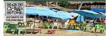
Un bañista fue atacado a balazos ayer en la tarde en la playa Caletito, de Acapulco.