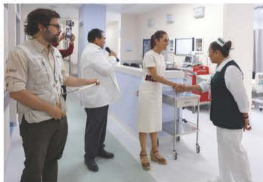
LA MANDATARIA inauguró un hospital en Mulegé, Baja California Sur, ayer.

LA PRESIDENTA firma acuerdo en Los Cabos para crear 37,500 casas; la meta sexenal es llegar al millón con el esquema Bienestar; incluye a no derechohabientes. pág. 9