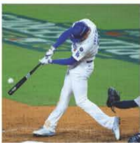
FREEMAN , tras conectar el cuadrangular que le dio la victoria a los Dodgers, ayer.