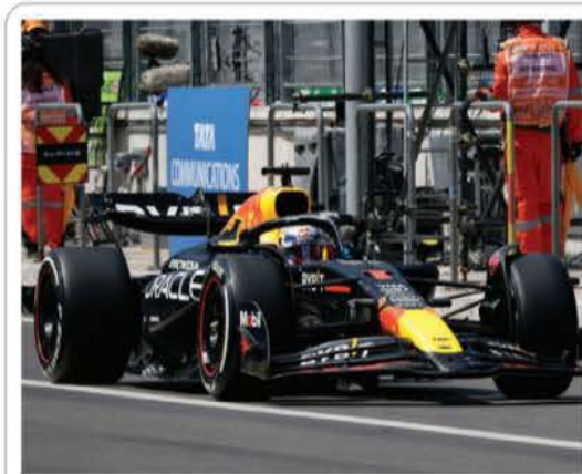
Primer día de prácticas del Gran Premio en CDMX