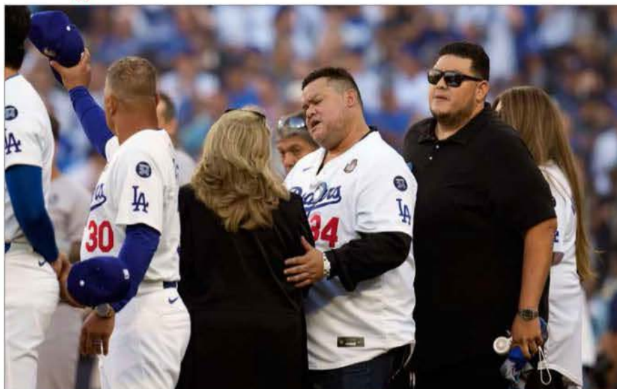
▲ Fernando Toro Valenzuela fue la estrella en el inicio de la Serie Mundial entre Dodgers y Yanquis, donde rindieron tributo al serpentinerino en un ambiente latino, entre flores y cánticos. Lo recordaron con videos y música de mariachi. En vez de primer lanzamiento, los ex beisbolistas Orel Hershiser y Steve Yeager colocaron la pelota en la parte posterior