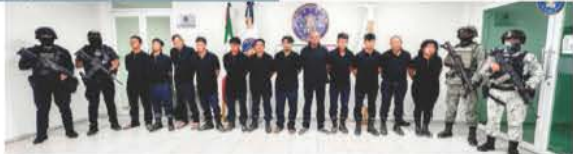
LOS DETENIDOS por la agresión en Tecpan de Galeana, ayer.