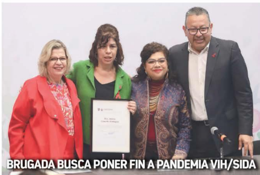
BRUGADA BUSCA PONER FIN A PANDEMIA VIH/SIDA

ANUNCIA MEDIDAS EN CDMX. La jefa de Gobierno de la CDMX, la morenista Clara Brugada, anunció que su gobierno buscará poner fin a la pandemia del VIH/SIDA en 2030. Adelantó que implementará acciones e invertirá recursos para aumentar la infraestructura de prevención, detección y atención de casos. POR FRANCISCO MENDOZA NAVA. Pág. 10