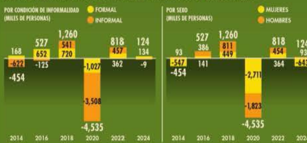
México | VARIACIÓN ACUMULADA DE LA POBLACIÓN OCUPADA, ENERO-SEPTIEMBRE