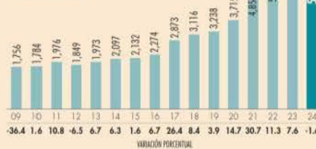
Ingresos por remesas en dólares | OCTUBRE DE CADA AÑO EN MILLONES DE DÓLARES