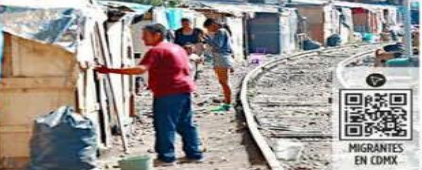
MIGRANTES EN CDMX