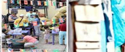
En Iztapalapa (izq.) y en la Gustavo A. Madero, se encuentran dos de los campamentos de migrantes en la Capital.

VILLAHERMOSA. Tabasqueños convocados por Morena marcharon en apoyo a Javier May y contra la violencia, que la dirigencia morenista atribuyó a una "herencia por corrupción política".