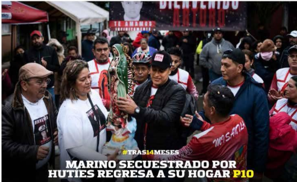
MARINO SECUESTRADO POR HUTIES REGRESA A SU HOGAR P10