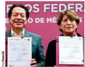
MARIO Delgado y Delfina Gómez, ayer.

LA GOBERNADORA Delfina Gómez y el secretario Mario Delgado firman convenio; buscan declarar al estado libre de analfabetismo. pág. 11