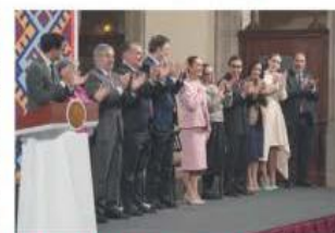
ENCUENTRO DE LA PRESIDENTA con empresarios en Palacio Nacional.