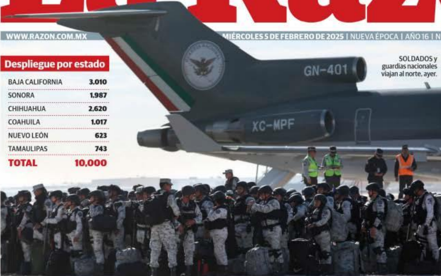
SOLDADOS y guardias nacionales viajan al norte, ayer.