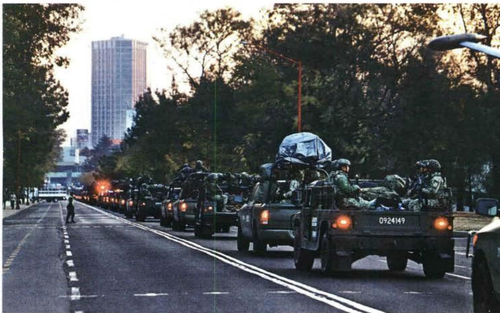
Los miembros de Guardia Nacional y Ejército fueron congregados para partir en el Campo Militar Uno A. JORGE CARBALLO