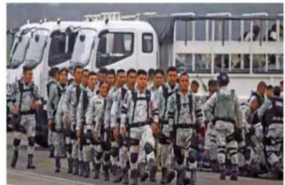
Nacional. Un día después de su anuncio, amarcó la redistribución de la GN en el país. / 4

Okupación. Los paracaidistas que cometen los despojos simulan contratos privados de compraventa, la presentación de escrituras falsas para 'ampararse' o la mera ocupación ilegal. / Pág.02