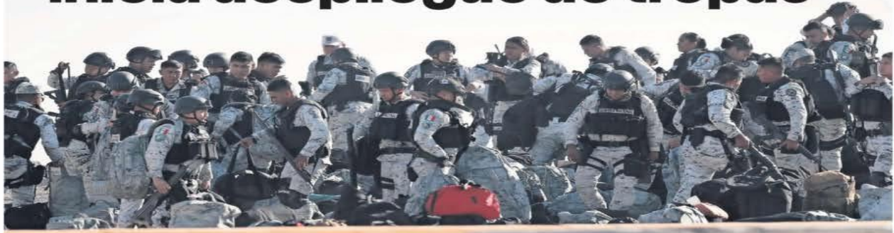
Elementos de la Guardia Nacional arribaron ayer a Ciudad Juárez, Chihuahua, para reforzar la seguridad fronteriza, tras el acuerdo entre los mandatarios de México y Estados Unidos.

Llegan mil 500 elementos de la Guardia Nacional a la frontera norte para contener el paso de migrantes y de fentanilo; la presidenta Claudia Sheinbaum asegura que no deja desprotegido al resto del país