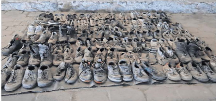
La Fiscalía del Estado de Jalisco informó sobre nuevos indicios de la investigación en el rancho Izaguirre, como imágenes de las decenas de pares de zapatos encontrados. Sin embargo, colectivos ya habían documentado con fotografías y videos los crematorios clandestinos y las prendas de vestir.