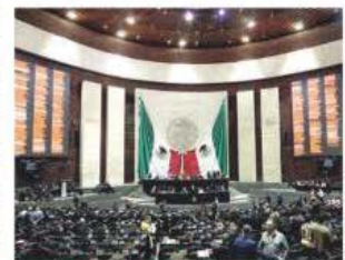
SESIÓN EN LA CÁMARA DE DIPUTADOS, donde ayer se aprobó la Reforma en materia de Soberanía Nacional.