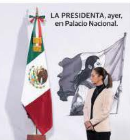
LA PRESIDENTA, ayer, en Palacio Nacional.