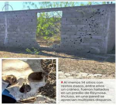
Al menos 14 sitios con restos óseos, entre ellos un cráneo, fueron hallados en un predio de Reynosa. Incluso, en una pared se aprecian múltiples disparos.