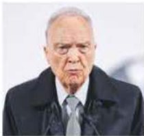
FGR. Indagará quién es el dueño y quiénes protegían dicho predio.

Gertz no cree que autoridad no supiera de 'rancho'