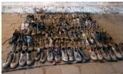
ZAPATOS hallados por buscadores en el rancho Izaguirre, en Jalisco.