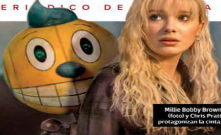
Millie Bobby Brown (foto) y Chris Pratt protagonizan la cinta.

Luego de varios éxitos con Marvel, los hermanos Russo cuestionan el uso excesivo de la tecnología en el filme Estado eléctrico .