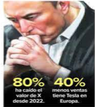
Ilustración: Jesús Sánchez

Desde diciembre, el fabricante de vehículos eléctricos se ha desplomado a la mitad del valor que tenía: de mil 600 millones de dólares a 768 mil millones ayer 12 de marzo. Además, la competencia china y europea derrumbó 40% sus ventas en Europa.