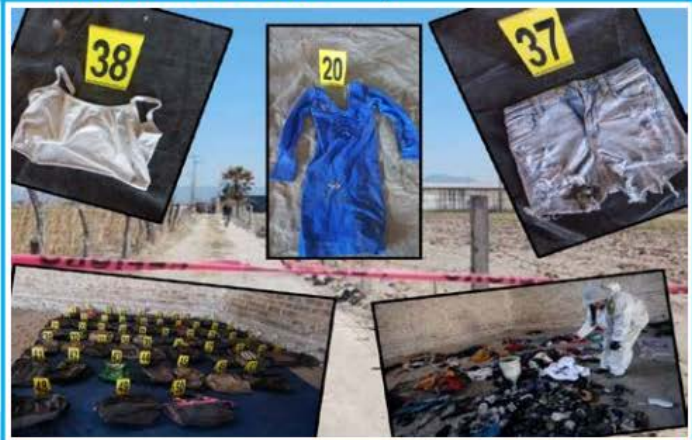
IMAGEN DEL DÍA

En solo cinco años, en México se han registrado 2,863 fosas clandestinas; del 1° de diciembre al 30 de abril de 2023, son 913 fosas las que se han ubicado en apenas 10 municipios dominados por el crimen organizado, según los datos de la Comisión Nacional de Búsqueda. Estos territorios, son regiones clave en disputa por cárteles como el de Sinaloa, Jalisco Nueva Generación, Golfo y Los Zetas, que han sido escenario de desapariciones masivas y violencia extrema. Entre los municipios estratégicos para estas organizaciones, destaca Tecomán, Colima, que encabeza la lista con 209 fosas, mientras que en Ahome, Sinaloa, se han identificado 120.