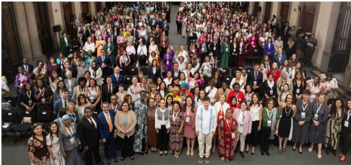
La Jefa del Ejecutivo federal inauguró los trabajos de la Conferencia Mundial de Mujeres Parlamentarias ante quienes confirmó su ya famoso "No llevo sola... llegamos todas".

PRESIDENTE DEL CONSEJO DE ADMINISTRACIÓN: JORGE KAHWAGI GASTINE // DIRECTOR GENERAL: RAFAEL GARCÍA GARZA // AÑO 28 N° 10,268 $10.00 // SÁBADO 15 MARZO 2025 // WWW.CRONICA.COM.MX