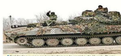
Soldados rusos se trasladan en la región de Kursk, Rusia, que es disputada con fuerzas ucranianas.