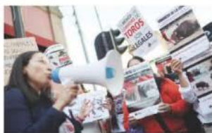
UN GRUPO de personas se manifiesta en contra de las corridas de toros, ayer, afuera del Congreso.

EMPRESARIOS taurinos rechazan la medida y llaman al diálogo para discutir tema; la PAOT celebra iniciativa de Brugada. pág. 13