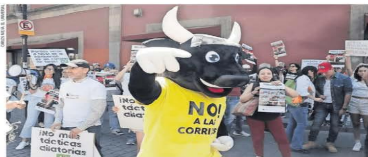
Mientras se efectuaba la aprobación del dictamen sobre las corridas de toros, afuera del Congreso capitalino, animalistas y simpatizantes del PVEM se manifestaron para exigir la prohibición de la tauromaquia.

a 5 años del COVID RUBÉN MIGUELES —ruben.miguels@eluniversal.com.mx Si no se hubieran suspendido las actividades por la crisis sanitaria, habría 23.8 millones de mexicanos trabajando en el sector formal, 1.4 millones más que ahora, indican investigadores a este diario. En su opinión, el gobierno perdió la oportunidad de reducir este saldo negativo, ya que pudo abrir la llave del gasto durante 2020 y 2021, cuando los hogares y empresas necesitaban apoyos para que la economía nacional se recuperara más rápido de la pandemia de Covid-19. Actualmente carece de espacio fiscal para estimular la actividad productiva ante la incertidumbre comercial, por lo que este déficit laboral se va a ampliar durante 2025, advirtieron los especialistas. | ECONOMÍA | A18