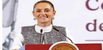
La mejor forma de fortalecer las economías de México y de EU es con integración económica sin aranceles, afirmó Sheinbaum.

Lo mejor para impulsar las economías de México y de Estados Unidos es mantener la unión, ya que así se compete mejor frente a otras regiones del mundo, aseguró la presidenta Claudia Sheinbaum. En su conferencia matutina, resaltó que, por el interés nacional, siempre hará lo que le convenga a México, por lo que buscará el diálogo con el gobierno de Estados Unidos. "Ha habido una relación de respeto, de diálogo y queremos que siga así, y vamos a poner todo de nuestra parte para que siga así", indicó. "Lo que nosotros, en todas las mesas de trabajo hemos planteado, es: mejor estar juntos, competir mejor frente a otras regiones del mundo, que separarnos". Sheinbaum dijo que "hay que tomar las cosas con mesura y no responder de