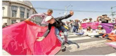
Africanos a la tauromaquia organizaron una protesta sobre Eje Central, en la que uno de ellos dio pases a otro con un capote.