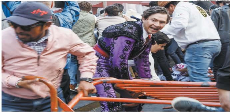
Afuera del Congreso de la Ciudad de México hubo protestas; un manifestante desprendió una de las vallas metálicas que rodeaban el acceso principal.