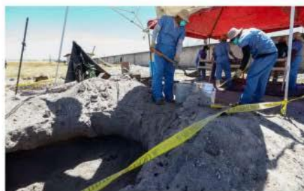
Teuchitlán: Difieren reportes de Guardia Nacional y Fiscalía de Jalisco

Por otra parte, durante la conferencia, el Gobierno denunció una campaña en redes sociales para atacar a Sheinbaum y al ex-presidente Andrés Manuel López Obrador, a raíz del descubrimiento del rancho de Teuchitlán. Según las estimaciones oficiales, la campaña costó 20 millones de pesos. PAG. 5