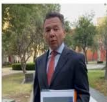
↑ Pablo Lemus

Por la mañana, el gobernador de Jalisco, Pablo Lemus, acudió a la reunión del Gabinete de Seguridad en Palacio Nacional y tras su salida comentó: “La estrategia es