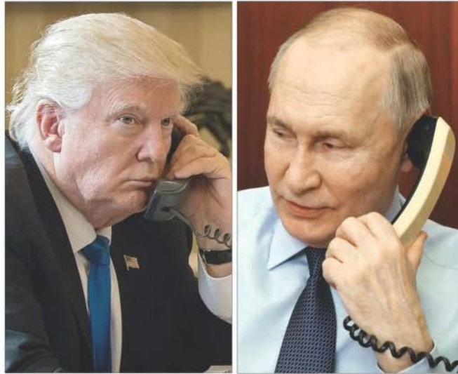
▲ Los presidentes de Estados Unidos y Rusia sostuvieron ayer una conversación telefónica que se prolongó por más de dos horas, aunque mucho de ese tiempo se perdió en la traducción.

EMIR OLIVARES, ALONSO URRUTIA Y CÉSAR ARELLANO / P 3 Y 25