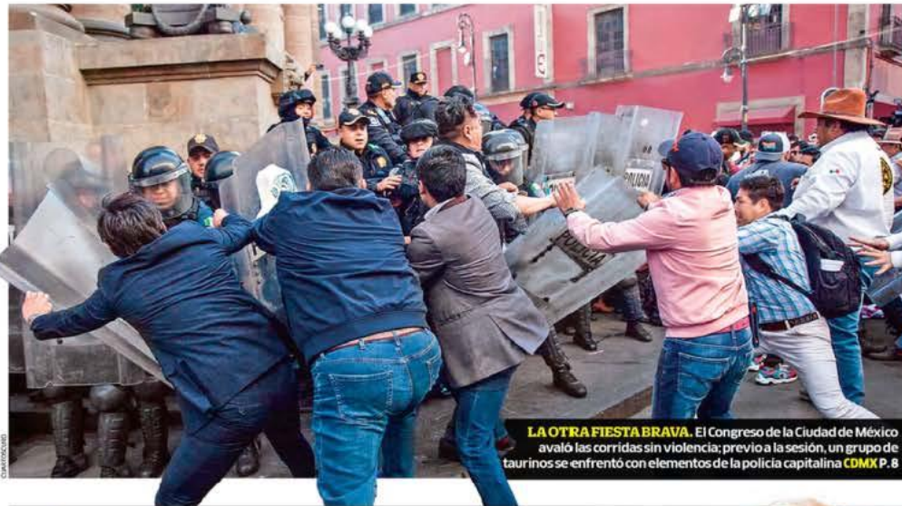
LA OTRA FIESTA BRAVA. El Congreso de la Ciudad de México avaló las corridas sin violencia; previo a la sesión, un grupo de taurinos se enfrentó con elementos de la policía capitalina CDMX P. 8