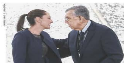
Sheinbaum y Cárdenas, en la conmemoración de la Expropiación Petrolera.

$20.44 DOLAR AL MENÚDO Año 108, Número 3999, CDMX, 36 págs. 39101 8 771870 150043