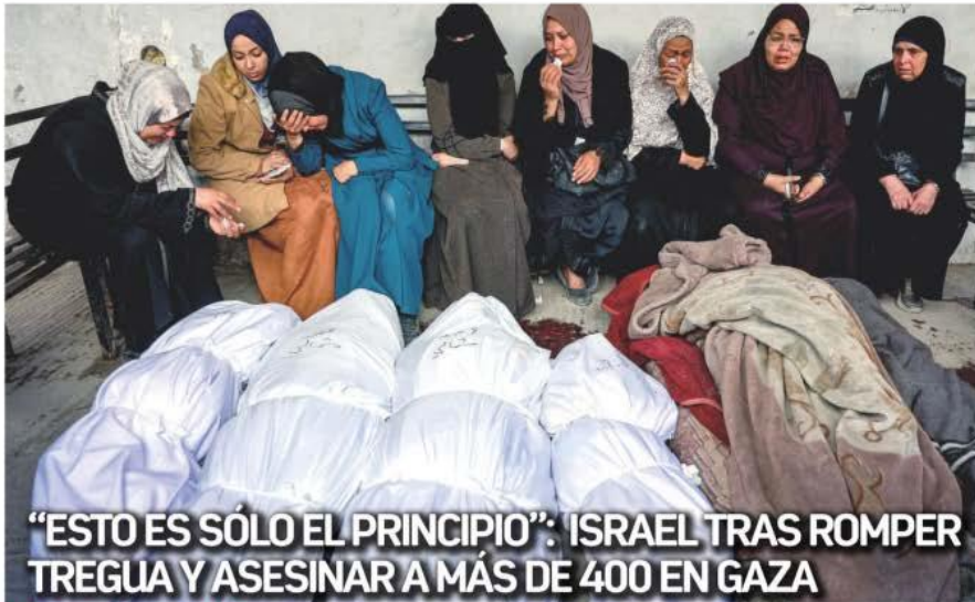
"ESTO ES SÓLO EL PRINCIPIO": ISRAEL TRAS ROMPER TREGUA Y ASESINAR A MÁS DE 400 EN GAZA

▶ LESIONAN A POLICÍA EN CHOQUE ENTRE TAURINOS Y ANTITAURINOS