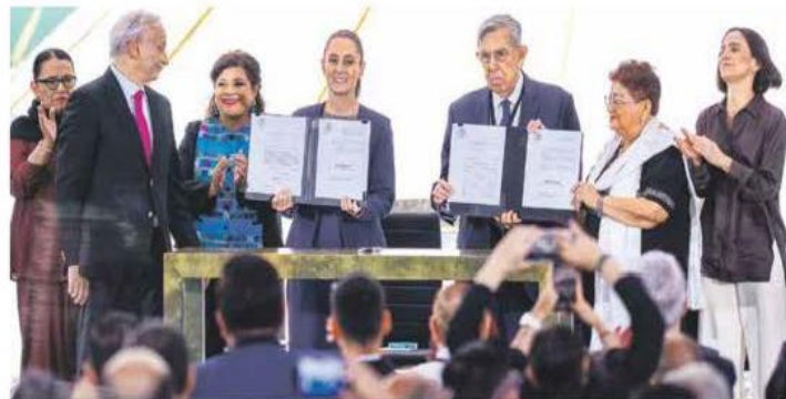
18 de marzo. El mejor homenaje que se puede hacer a Lázaro Cárdenas es la publicación de las leyes que recuperan Pemex.