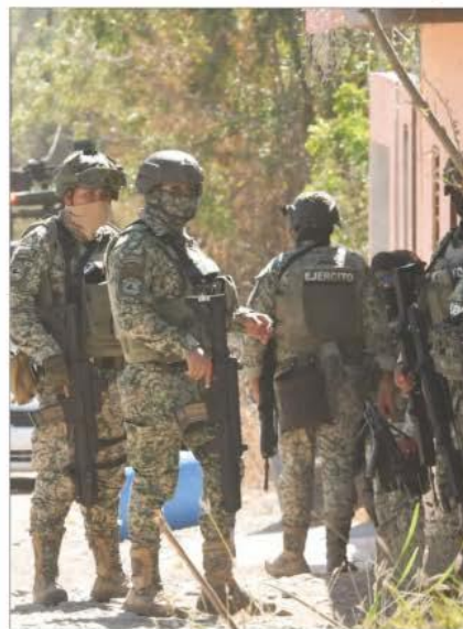
▲ Acotado por la Federación, el gobernador de Sinaloa no da entrevistas y sólo habla en eventos controlados para minimizar o evadir declarar sobre los hechos de violencia que agobian a su estado. Hay quien dice que le llegó tarde