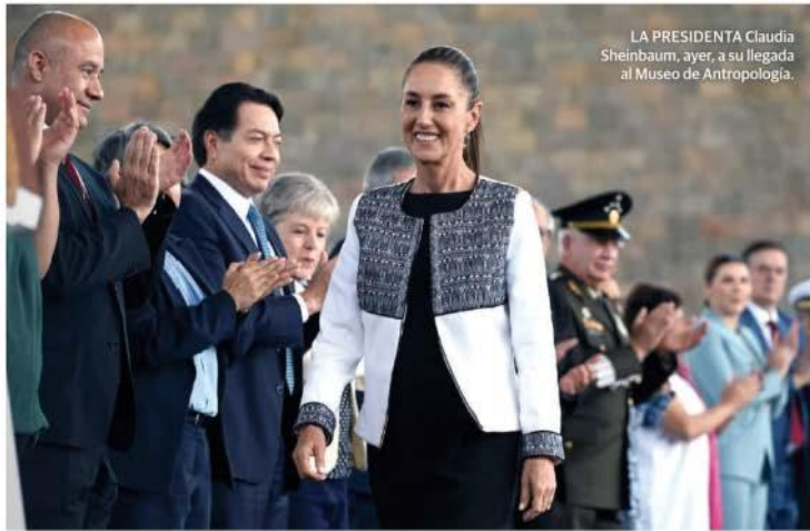
LA PRESIDENTA Claudia Sheinbaum, ayer, a su llegada al Museo de Antropología.

EXENCIÓN de tarifas, por buena relación con EU y fuerza de Gobierno y el pueblo, destaca, va por condiciones preferenciales en autos, acero y aluminio en próximos 40 días.