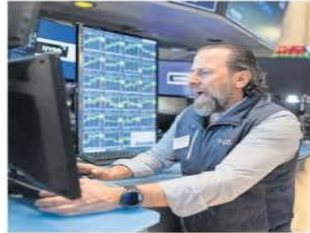
La Bolsa de Valores de Nueva York inició la jornada de ayer con elevada tensión en el mercado. | A23 Y A7 |

automotriz, como Toyota, Honda y Nissan. En contraparte, el índice de Precios y Cotizaciones de la Bolsa Mexicana de Valores avanzó 0.54%, uno de los pocos en el mundo que registraron ganancias, ya que Estados Unidos no impuso aranceles adicionales al país. La divisa nacional en los mercados internacionales se fortaleció, al cerrar en 19.94 pesos por dólar, una apreciación de 54 centavos contra la jornada anterior. A la par del repudio de los mercados a las tarifas de Trump, el primer ministro de Canadá, Mark Carney, dijo que su país aplicará aranceles de 25% a la importación de autos estadounidenses que no cumplan las reglas del T-MEC. | A23 Y A7 |