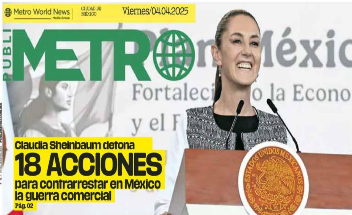
Reacción. En su presentación en el Museo de Antropología, la mandataria destacó que entre los retos considera la participación privada en el sector energético y poner en marcha proyectos de infraestructura. / CONTRA