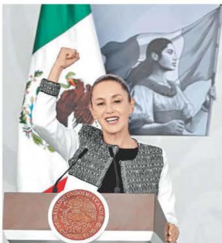
La Presidenta expuso ante su gabinete los principales puntos del plan que permitirá afrontar el entorno arancelario. ARIELOJEDA

F. MUEBILLO Y J. SAUCEDO - PÁGS. 20 Y 21