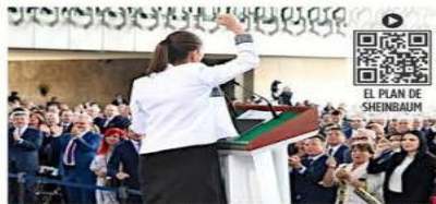
Sheinbaum fue respaldada ayer por legisladores de la 4T, empresarios y líderes sindicales.