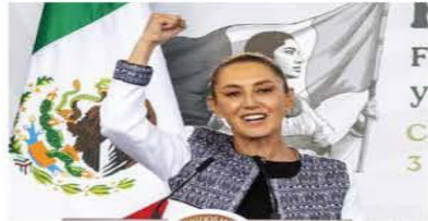
En un acto realizado en el Museo de Antropología, la presidenta Sheinbaum reiteró su compromiso de impulsar el desarrollo del país.

Para enfrentar los aranceles impuestos por Donald Trump, la presidenta Claudia Sheinbaum anunció 18 acciones para fortalecer la economía nacional, como parte del Plan México. En el Museo de Antropología, ante funcionarios, gobernadores y empresarios, detalló que los objetivos son el fortalecimiento del mercado interno y el salario, aumentar las soberanías alimentaria y energética, así como la producción nacional. También, disminuir las importaciones de países con los que no tenemos tratado comercial y fortalecer los programas para el bienestar. Entre las acciones a realizar están acelerar proyectos de obra pública, de