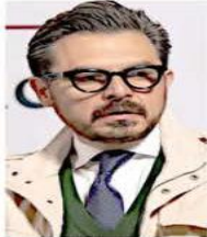
Zoé Robledo, director del IMSS.