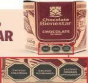
productos de café, miel y maíz.