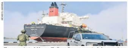
El aseguramiento del buque Challenge Procyon es parte de las operaciones de inteligencia que el gobierno lanzó contra el huachicoleo fiscal. | NACIÓN | A9

pecto a los hidrocarburos que lleva, con el fin de evadir impuestos. La red para el llamado huachicoleo fiscal incluye a dueños de gasolineras, transportistas y trabajadores portuarios. Empresarios gasolineros calculan que uno de cada tres litros de combustibles que se comercializan en el país son ilícitos. Diariamente se venden 180 millones de litros de gasolina y diesel, por lo que 60 millones se comercializan ilegalmente. Esa cantidad representa un daño a la economía equivalente a 525 mil 600 millones de pesos al año. El Challenge Procyon ha atracado al menos dos ocasiones en territorio nacional y fue asaltado tres veces por piratas, previamente a ser incautado por autoridades mexicanas. | NACIÓN | A9