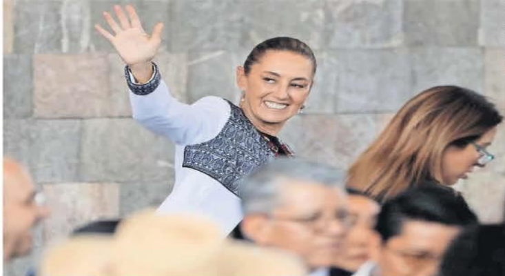
La presidenta Claudia Sheinbaum anunció 18 acciones para fortalecer el Plan México, entre las que destacan buscar la autosuficiencia en la industria automotriz ante los aranceles de Trump, en los que, dijo, México ha tenido trato preferencial gracias al diálogo. | A4 |